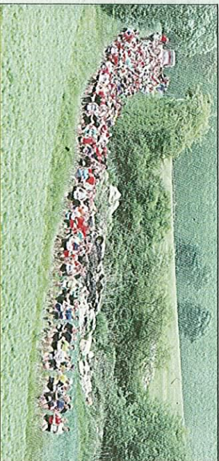
La pluie des derniers jours a compliqué la tâche des concurrents.